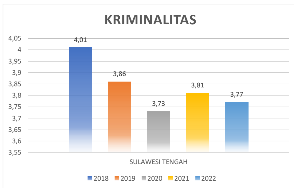
Gambar 1. Jumlah Kriminalitas Provinsi Sulawesi Tengah (persen) 2018-2022